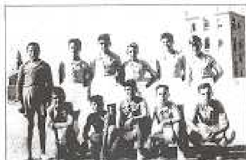
El Uracan en 1953