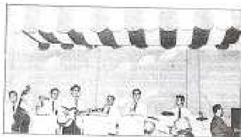
Orquesta Costa Blanca