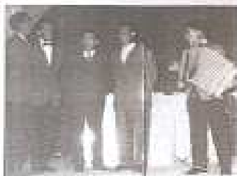
Trio Los Percheros en 1951