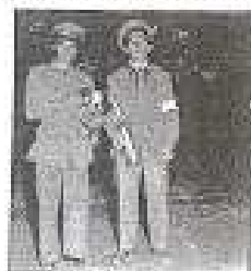
En las de Bellas de Valencia y con la Banda de la Cruz Baja de Alicante años en 1954