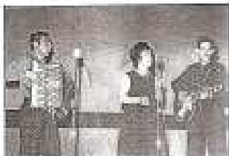
Trio Los Lumbreras 1956