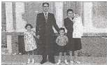
Con mis padres y mis hermanas en 1967

De pequeño podía pasar el día con un bonito azado, como único alimento y era casi feliz. En mi quinto cumpleaños mi madre me obsequio con una tortilla de un huevo solo para mí, con el consiguiente recelo de mis hermanas (claro).