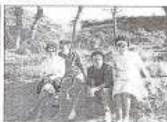
De novios con amigos

Por mi espíritu de superación, en mi etapa de alfarero me hice especialista, (yesalre) una profesión que durante muchos años, ha sido uno de los motores de la economía caudetana generando grandes especialistas reconocidos a nivel nacional e incluso fuera de nuestra fronteras.