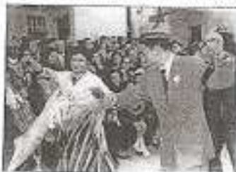
Bailes en 1955

Por esta época le seguía los pasos a la mujer que durante mas de 55 años a sido y es mi amiga, mi novia y mi mujer, con la que comparto seis hijos y hasta hoy ocho nietos, luchando juntos por ellos ayudándoles en todo cuanto podemos para mantenernos unidos como familia.