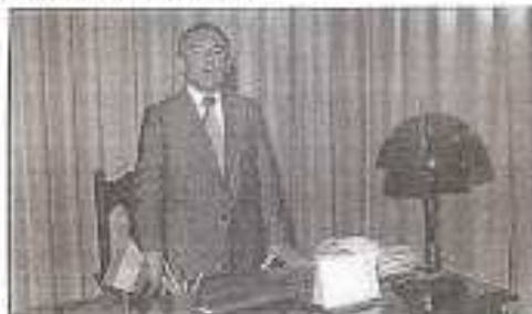
Mi despacho en la alcaldía